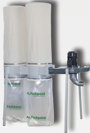
MULTI ALFA - HPF

A WIDE RANGE OF ACCESSORIES AND OPTIONAL ARE AVAILABLE FOR EVERY CUSTOMER NEED.