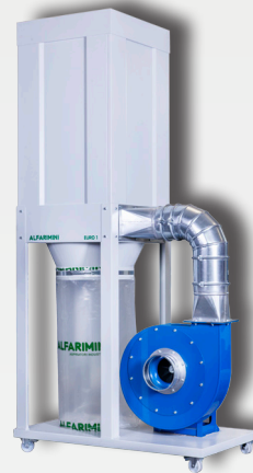
EURO 1 - HPFH