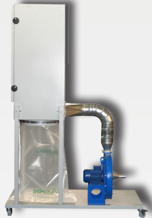
MINI EURO - HPF