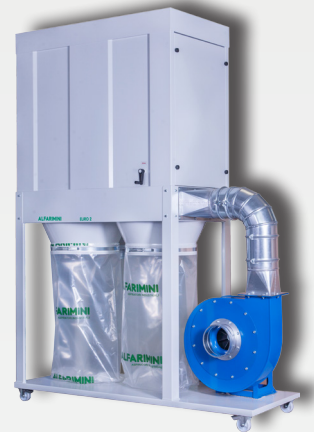
EURO 2 - HPFH