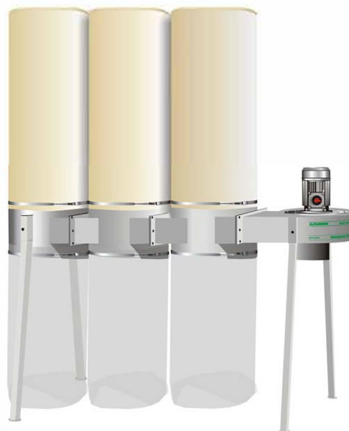
COMPOSIZIONE A 3 ELEMENTI FILTRANTI VERSION WYTH 3 FILTERING ELEMENTS VERSION A 3 ELEMENTS FILTRANTS VERSION MIT 3 FILTERELEMENTEN MISURE D'INGOMBRO - OVEALL DIMENSIONS ENCOMBREMENT - PLATBEARF 960 X 2200 X 2450

Drehstrommotor von 4,12 kW (5,5 PS) (Saugleistung 6.000 m 3 /h) Zentralstützstab Ø 250 mit mehreren Ausgängen Kollektoren Schlauch aus feuerhemmendem Kunststoff Filtereinsätzen zur Entstaubung Ø 500 mm.